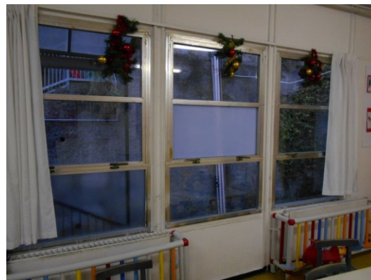
Figura 2.1 - Particolare dei serramenti