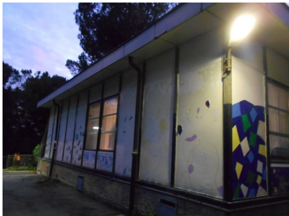
Figura 1.3 – Rilievo termografico della parete