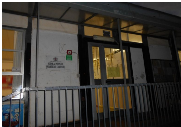
Figura 1.1 - Particolare della facciata principale