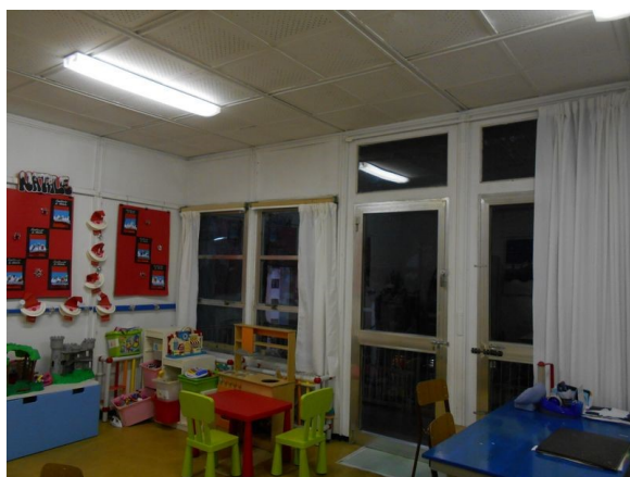
Figura 2.2 - Particolare dei serramenti